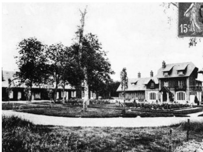
MENESTREAU-en-VILLETTE (Loiret) — La Vronnière